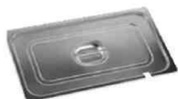
Deckel perforiert für Servierkelle