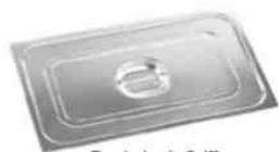
Deckel mit Griff