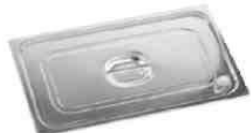
Deckel mit Dichtung