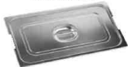
Deckel perforiert für feste Griffe